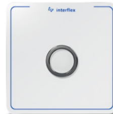
Zutritts-Terminal IF-800 in weißer Ausführung